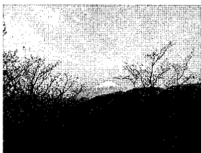
遙か富士山を望む