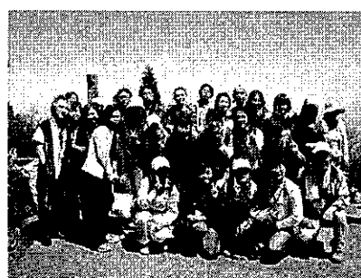
大山山頂での記念撮影