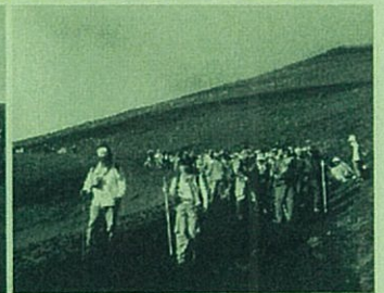
下山も厳しい富士登山