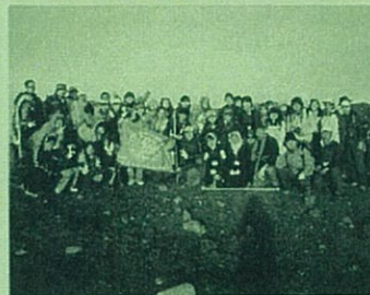
富士山頂上での記念撮影