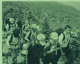
六合目安全指導センター付近

御来光館発(2:30)~富士山山頂(4:30)御来光を仰ぐ~山頂発(6:00)~御来光館発(8:00) 河口湖口五合目着(11:30)~富士健康センター(13:00)入浴・昼食・休憩-温泉に入ってゆっくり汗を流そう富士健康センター発(15:00)~新宿駅西口着(18:00)