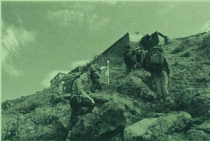
険しい道が続く八合目付近 山小屋までもうひと頑張り

実施日 : 8月2日(月)~3日(火) 参加募集人数 : 外国人留学生 40人 : 日本人青年・学生10人 参加費 : 20,000円 (1日目の昼食は各自用意)